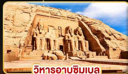
วิหารอาบูซิมเบล

น้ำหนักกระเป๋า 23Kg. (บินระหว่างประเทศ และบินภายใน)