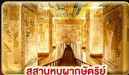
สุสานหุบผากษัตริย์