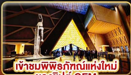
เข้าชมพิพิธภัณฑ์แห่งใหม่ ของยิปต์ GEM

ชม 1 ใน 7 สิ่งมหัศจรรย์ของโลก “มหาพีระมิดแห่งกิซ่า”