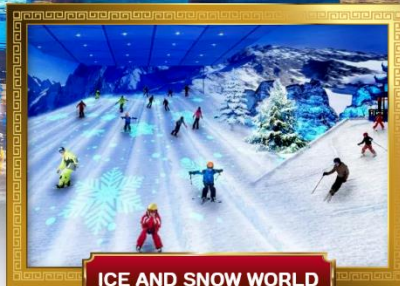
ICE AND SNOW WORLD