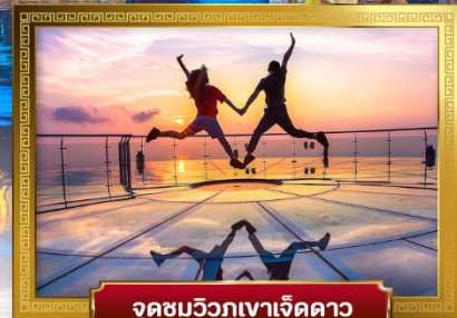
จุดชมวิวกูเขาเจ็ดดาว