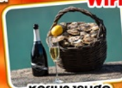
หอยนางรมสด กับไวน์ขาว