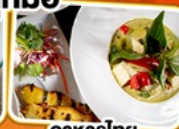
อาหารไทย ในยุโรป

บินทรู TURKISH AIRLINES FULL SERVICE น้ำหนักกระเป๋า 30 kg.