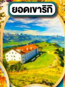
ยอดเขารีกิ