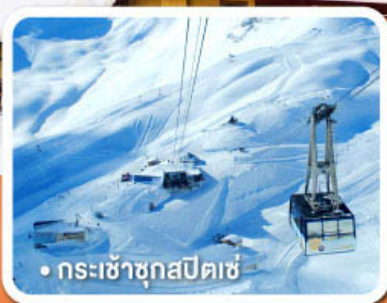
กระเช้าชุกสปีตเซ