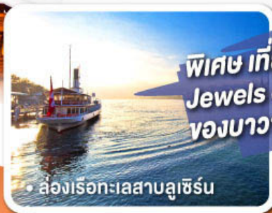
ล่องเรือทะเลสาบลูเซิร์น

พิเศษ เที่ยวบินทาง Jewels of Romantic Europe ของบาวาเรียและทิโรล