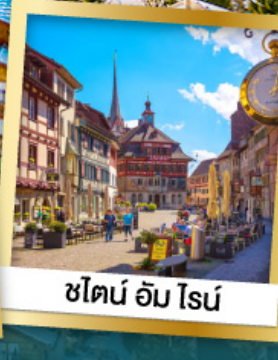
ซึร์ริช อัม โรส