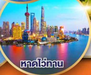
หาดไว่กาน