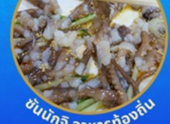
ชั้นนักชี อาหารท้องถิ่น