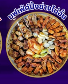
ซูฟเฟ็ตบึงย่างไข่ม้วน