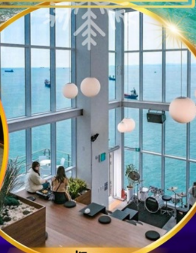
คาเฟ่วิวทะเล

ถ่ายรูปชิคๆ หมู่บ้านวัฒนธรรมคัมซอน เชคอิน คาเฟ่ริมทะเล วิวหลักล้าน ขึ้นเคเบิลคาร์ ชมทะเลปูซาน นั่งรถไฟปิ๊กปิ๊ก sky capsule ห้ามพลาด!! ตลาดปลาที่ใหญ่ที่สุด ชิมของอร่อยที่ตลาดแฮอนแด อิสระช้อปปิ้ง Lotte Duty Free