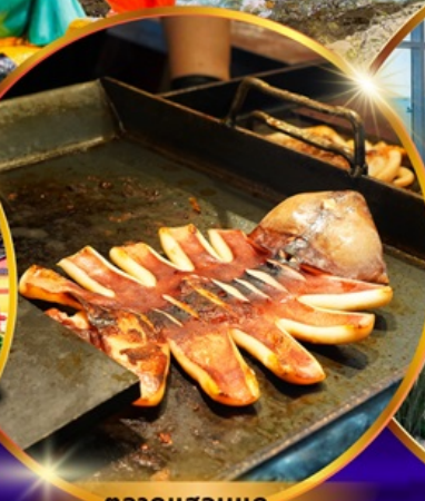
ตลาดแฮอนแด