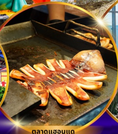
ตลาดแฮอนแด