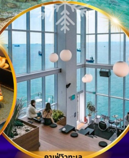
คาเฟ่วิวทะเล

ถ่ายรูปชิคๆ หมู่บ้านวัฒนธรรมคัมซอน เชคอิน คาเฟ่ริมทะเล วิวหลักล้าน ขึ้นเคเบิลคาร์ ชมทะเลปูซาน นั่งรถไฟปิ๊กปิ๊ก sky capsule ห้ามพลาด!! ตลาดปลาที่ใหญ่ที่สุด ชิมของอร่อยที่ตลาดแฮอนแด อิสระช้อปปิ้ง Lotte Duty Free