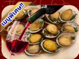
ซีฟู้ด เป้าอื้อโฮบิตาง