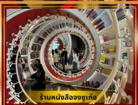
ร้านหนังสือจวงซูเก้อ