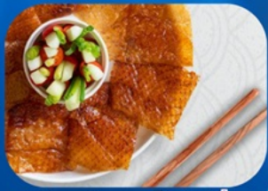
พิเศษ!! เมนูเป็ดปักกิ่ง