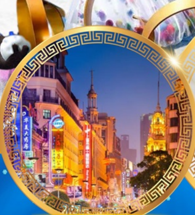
ถนนคนเดินหนานจิง

พักโรงแรม 4 ดาว ★★★★★ บริการอาหารท้องถิ่น