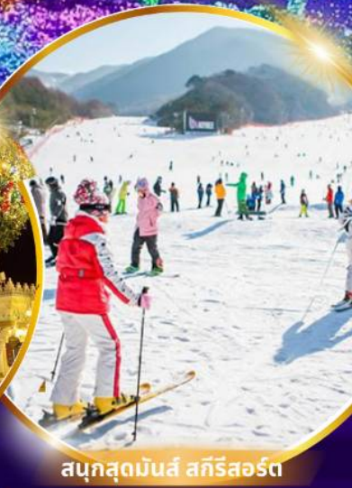
สนุกสุดมันส์ สกีรีสอร์ท

ชมจอ LED ขนาดยักษ์ที่รีสอร์ท 5 ดาว ใหญ่ที่สุดในเอเชียเหนือ สัมปัสหิมะสกีรีสอร์ท สนุกสุดมันส์ สวนสนุกเอเวอร์แลนด์ ชมพระราชวังคยองบกคุง ย้อนอดีตหมู่บ้านบุคซอน อันอก อิสระช้อปปิ้งคังนัม Lotte Duty Free