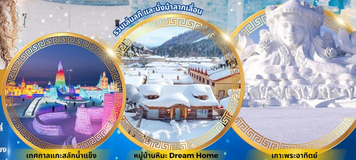
เทศกาลแกะสลักน้ำแข็ง

จตุรัสโบสถ์เซินโซเฟีย ถนนจงยวง หมู่บ้านหิมะดินแดนมหัศจรรย์ อนุสาวรีย์ฝั่งหง สนุกสนานกับลานสกียาปูลี ถนนแฉ่ยู่เจีย เขาแกะหลัว เขาปังจวู ภาพเขียน Ice and Snow แม่น้ำซงฮัวเจียง โซวี่ว้ายน้ำแข็ง เกาะพระอาทิตย์