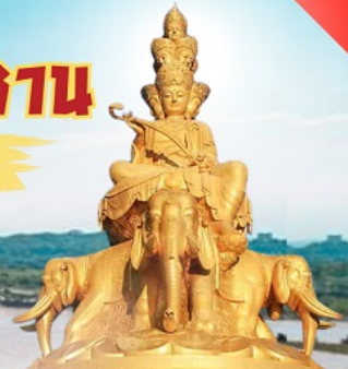
พระโพธิสัตว์ผู้เสวย