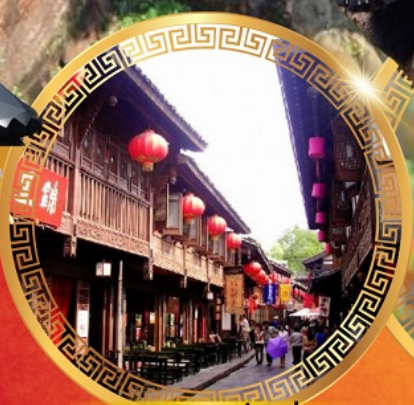
ถนนโบราณจีนหลี

ล่องเรือมีสการพระหลวงพ่อโตเล่อชาน สักการะพระโพธิสัตว์ผู้เสวย เขาจ้อไบ๋ ย่อนเวลาชมถนนจีนโบราณ ชมความน่ารักของหมีแพนด้า ชมความยิ่งใหญ่ แสงสียามค่ำคืน สักการะ วัดต้าเจ้อ กว่า1600ปี อิสระช้อปบิงตึก IFS