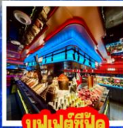
บุฟเฟ่ต์ซีฟู้ด