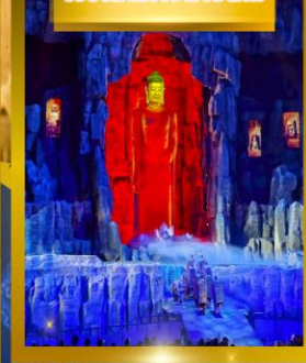
โชว์เส้นทางสายไหม