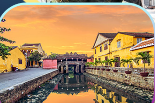
เมืองเก่า Hoi An