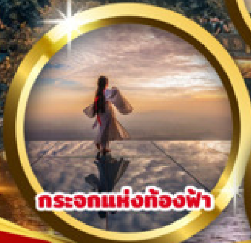
กระเอกแห่งท้องฟ้า