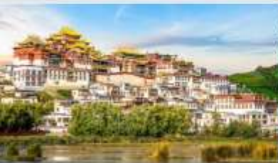
วัดลามะชงจ้านหลิน