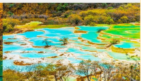
อุทยานแห่งชาติหวงหลง

*ทางบริษัทฯ ขอสงวนสิทธิ์ในการสลับโปรแกรมทัวร์ตามความเหมาะสมขึ้นอยู่กับสถานการณ์หน้างาน โดยคำนึงถึงผลประโยชน์ของลูกค้าเป็นสำคัญ