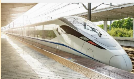
นั่งรถไฟความเร็วสูง