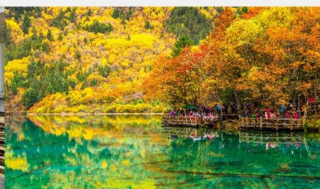
อุทยานแห่งชาติจิวจ้ายโกว