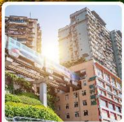
รถไฟฟ้ากะลุดึก