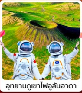
อุทยานภูเขาไฟอุลันฮาตา