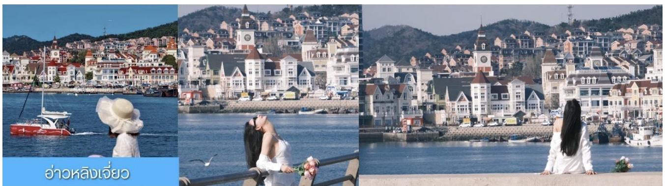
อ่าวหลังเจียว

จากนั้นนำท่านเที่ยวชม ทำเรือประมงหู่ทาน 大连渔人码头 เป็นจุดเช็คอินที่โดดเด่นด้วยสถาปัตยกรรมสไตล์ยุโรปสีส้มสดใส ผสมผสานกลิ่นอายเมืองท่าดั้งเดิมเข้ากับบรรยากาศสุดโรแมนติคที่เต็มไปด้วยเรือประมง คาเฟ่ ร้านอาหาร และจุดชมวิวยริมหาด