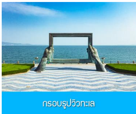
กรอบรูปวิวกทะเล