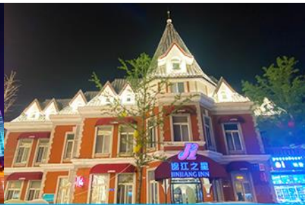
ถนนรัสเซีย

วันที่ห้า เมืองฮาร์บิน –รถไฟความเร็วสูงสู่เมืองต้าเหลียน – ล่องเรือเมืองเวนิสต้าเหลียน –จัตุรัสชิงไห่ – ถนนรัสเซีย