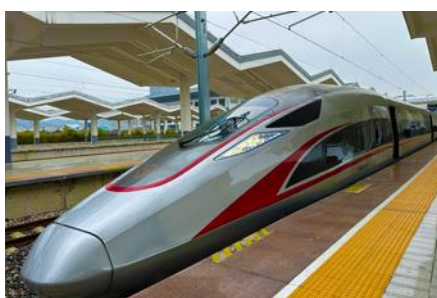
บัสรถไฟความเร็วสูง

พักที่ XINGYU INTERNATIONAL หรือ โรงแรมระดับ 4 ดาวท้องถิ่น