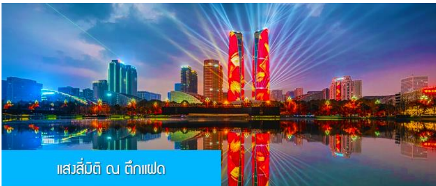
แสลลีมีตี ณ ตึกแฝด