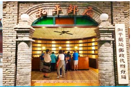
เมืองโบราณจำลอง