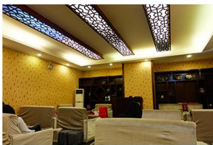
ศูนย์แพทย์แผนจีน

อัตราค่าบริการสำหรับโปรแกรมเสริมการแสดงชุด The love Story of Wooden man and Fairy Fox ท่านละ 400 หยวน (หรือประมาณ 2000.-บาทขึ้นอยู่กับอัตราแลกเปลี่ยน) ระยะเวลาที่ใช้ในการเที่ยวชมการแสดง ประมาณ 3 ชั่วโมง รวมเวลาเดินทางไปกลับค่าบริการรวม ค่าบัตรเข้าชม ค่ารถรับ ส่ง และค่าน้ำเที่ยวของไกด์ท้องถิ่น