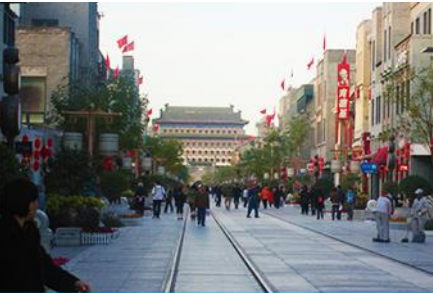
ถนนเฉียนเหมิน