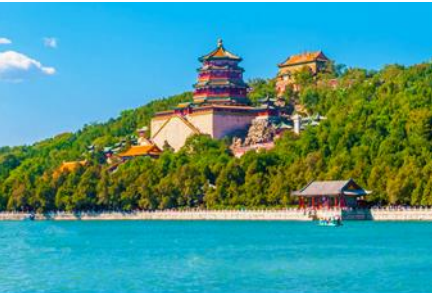
พระราชวังฤดูร้อนหยี่เหอหยวน