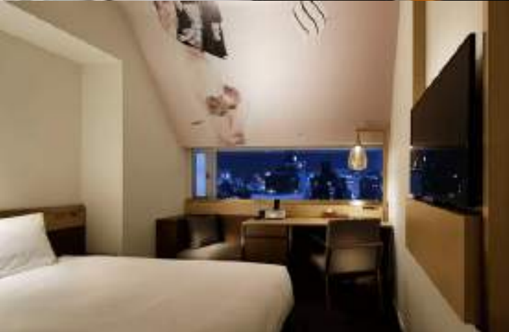
Standard Twin Room size: 17 m 2