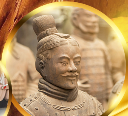
สุสานทหารจีนซี