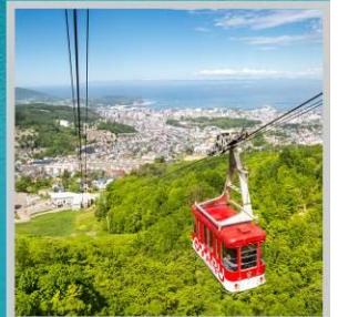
"MT. TENGU ROPEWAY"