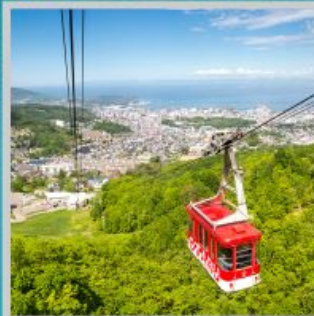
"MT. TENGU ROPEWAY"