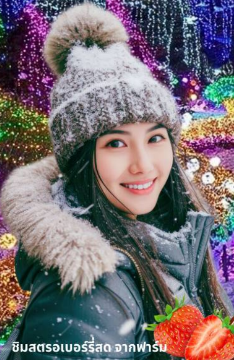
ชิมสตรอเบอร์รี่สด จากฟาร์ม