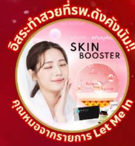
อิสระทำสวยที่พ.ดังคังนัม!! SKIN BOOSTER ขุนนางอาหารรายการ Let Me In

ชมจอ LED ขนาดยักษ์ที่รีสอร์ท 5 ดาว ใหญ่ที่สุดในเอเชียเหนือ ชมพระราชวังเคียงบกกรุง ย้อนอดีตหมู่บ้านบุคซอน ฮันอก ใส้ชุดฮันบก ทำข้าวห่อสาหร่าย อิสระช้อปปิ้ง Lotte Duty Free