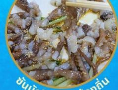
ชั้นนักกีฬา อาหารท้องถิ่น