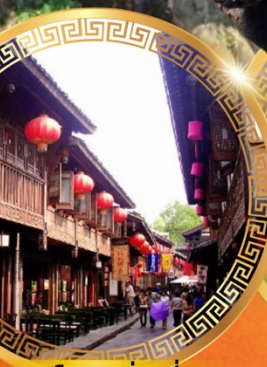
ถนนโบราณจีนหลี