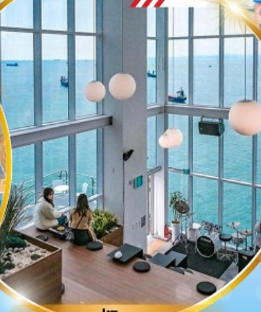
คาเฟ่วิวทะเล

ถ่ายรูปชิคๆ หมู่บ้านวัฒนธรรมคิมซอน ใหม่ล่าสุด คาเฟ่ริมทะเล วิวหลักล้าน ขึ้นเคเบิลคาร์ ชมทะเลปูซาน ห้ามพลาด!! ตลาดปลาที่ใหญ่ที่สุด ซิมของออร์อยที่ตลาดแฮอนแด ซุปปังตลาดพื้นเมือง แหล่งซูปปังใต้ดิน ซิมซอน อิสระซูปปัง Lotte Duty Free