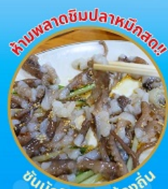
ห้ามพลาดซิมปลาหมึกสด!! ซิมหนัก อาหารท้องถิ่น

ถ่ายรูปชิคๆ หมู่บ้านวัฒนธรรมคิมซอน ใหม่ล่าสุด คาเฟ่ริมทะเล วิวหลักล้าน ขึ้นเคเบิลคาร์ ชมทะเลปูซาน ห้ามพลาด!! ตลาดปลาที่ใหญ่ที่สุด ซิมของออร์อยที่ตลาดแฮอนแด ซุปปังตลาดพื้นเมือง แหล่งซูปปังใต้ดิน ซิมซอน อิสระซูปปัง Lotte Duty Free