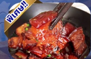
เมนูหมุสามชั้นตุ๋นน้ำแดง

พักโรงแรม 4 ดาว ★★★★★ ฟรี ประกันอุบัติเหตุ บริการ อาหารท้องถิ่น