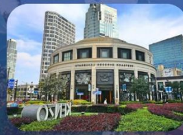
สตาร์บิกใหญ่ที่สุดในเอเชีย