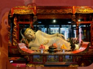
สักการะวัดพระหยกขาว