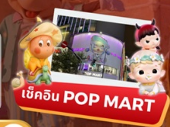
เช็คอิน POP MART