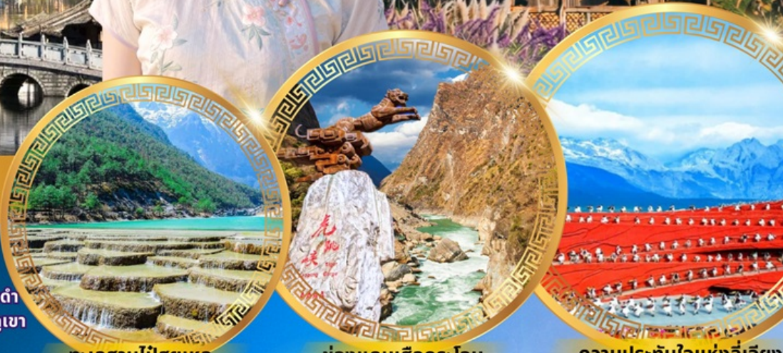
ทะเลสาบไป๋สือเหอ

พักโรงแรม 4 ดาว ★★★★★ ฟรี ประกันอุบัติเหตุ บริการอาหารท้องถิ่น