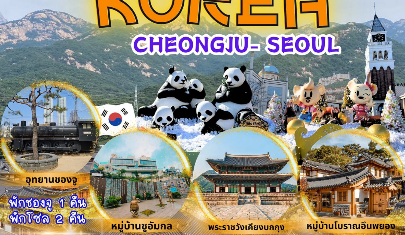
อุทยานซองจู