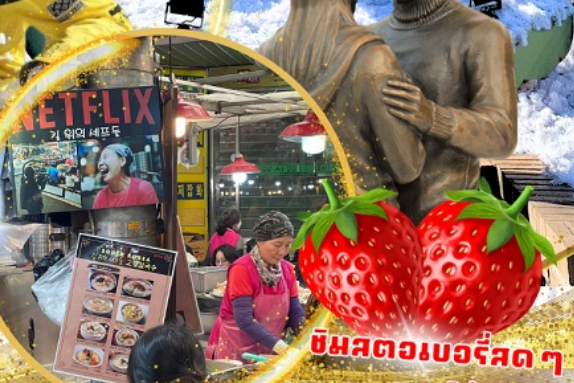
ตลาดกวางจง