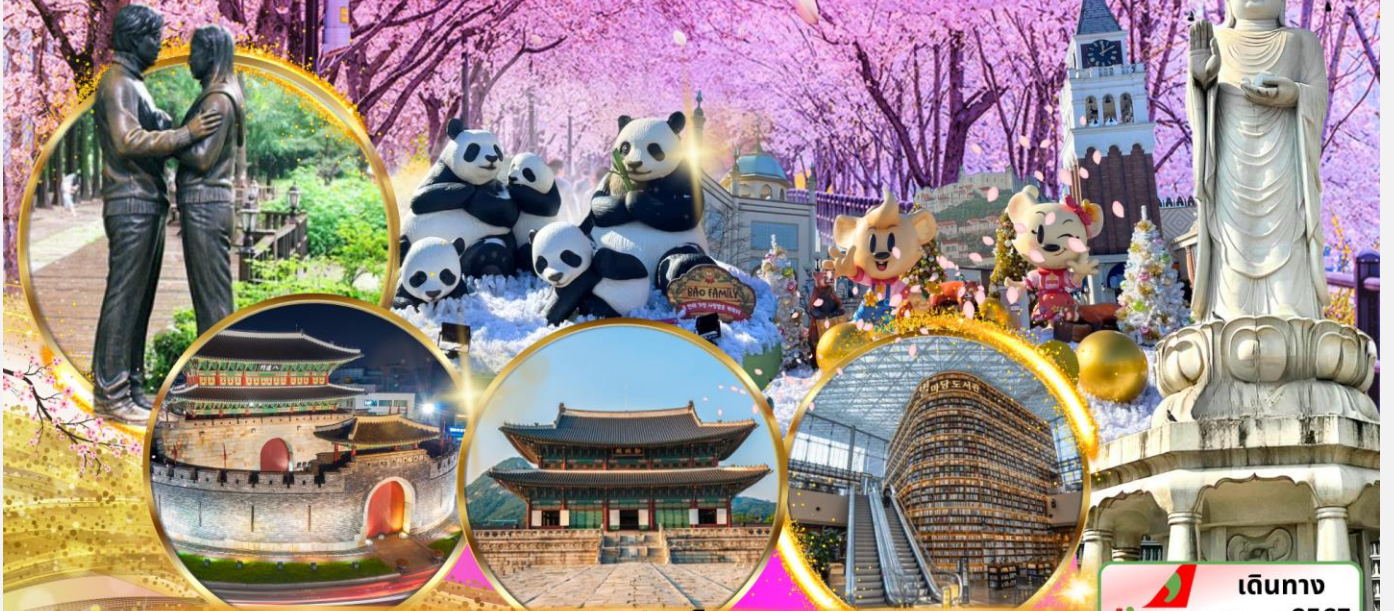
ป้อมฮวาซอง