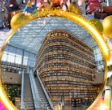
ห้องสมุด Coex mall

เดินทาง t'way เมษายน 2567 น้ำหนัก 20 Kg Carry on 10 kg