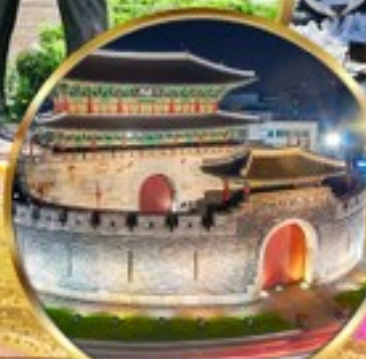
ป้อมฮวาซอง