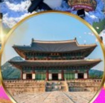
พระราชวังเคียงบ็อกกุง