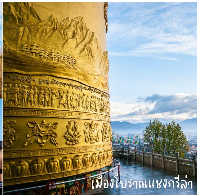
เมืองโบราณแชงกรีล่า

ค่ำ 📍บริการอาหารค่ำ ณ ภัตตาคาร ที่พัก ➡️ SHU JIN MU YUN 4* หรือเทียบเท่า