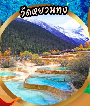
วัดเขยวทง