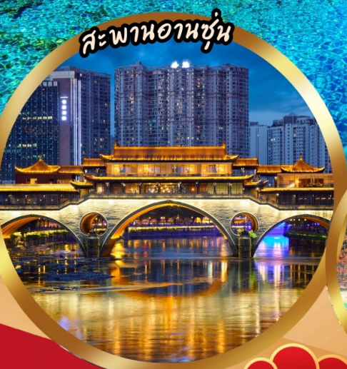
สะพานอันซุ่น