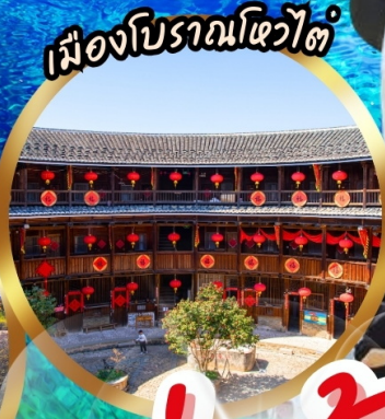
เมืองโบราณโหวไต