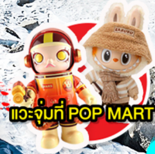
แวะจุ่มที่ POP MART