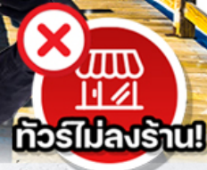
✗ ทิวรี่ไม่ลงร้าน!