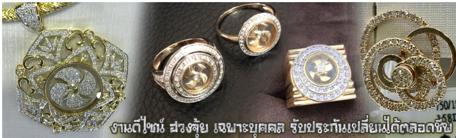
งานดีไซน์ สวยล้ำ เฉพาะบุคคล รับประกันเปลี่ยนไม่ได้ตลอดชีพ

นำท่านเยี่ยมชม โรงงานจิวเวลรี่ ที่ขึ้นชื่อของฮ่องกงพบกับงานดีไซน์ที่ได้รับรางวัลอันดับยอดเยี่ยม และใช้ในการเสริมดวง เรื่อง ฮวงจุ้ยนำความโชคดี มั่งคั่งแก่ผู้สวมใส่ ซึ่งในเมืองไทยก็ได้นิยมแพร่หลายออกไป ไม่ว่าจะเป็นกลุ่ม ดารา นักการเมือง พ่อค้าแม่ขายที่ประกอบธุรกิจ เจ้าของกิจการห้างร้านต่าง ๆ ซึ่งเชื่อกันว่าจะนำสิ่งดี ๆ ปัดเป่าสิ่งชั่วร้ายให้กับบุคคลที่สวมใส่ ซึ่งจะมีมากมายหลายชนิด เช่นจี้กั้งหัน แหวนรูปต่าง ๆ นาฬิกาข้อมือ (ซึ่งผู้สวมใส่จะได้รับการดูลายมือจากซินแซประจำร้าน เพื่อแนะนำวิธีการเสริมดวงในการสวมใส่โดยไม่ได้ค่าบริการ)