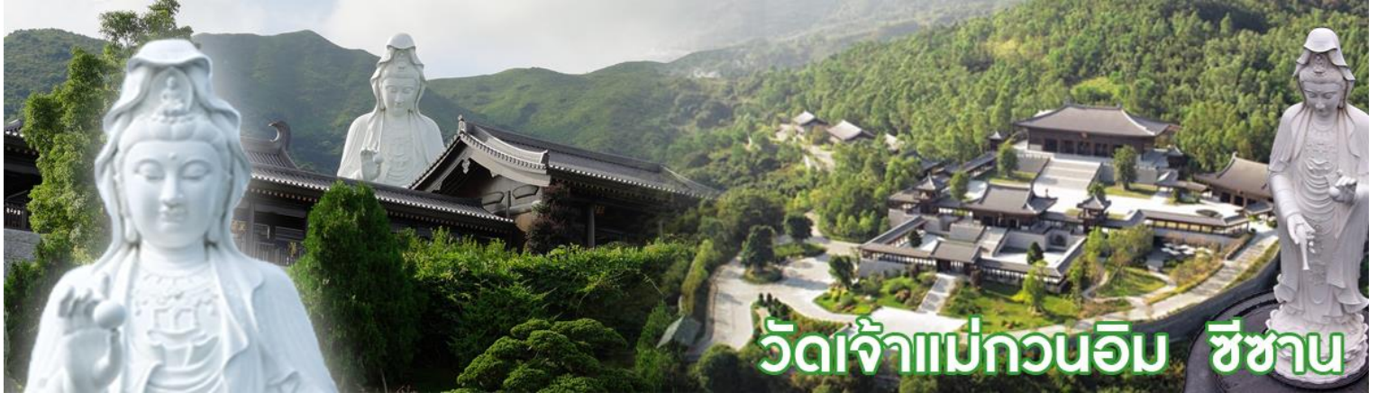
วัดเจ้าแม่กวนอิม ชีซาน

หลังจากนั้นนำท่านสู่ วัดชีซาน หลายคนที่เคยไปเที่ยวฮ่องกงมาแล้ว อาจจะยังไม่เคยเยือนวัดชีซาน หรือ Tsz Shan Monastery เป็นวัดที่มีเจ้าแม่กวนอิมองค์ใหญ่เป็นอันดับสองของโลก มีความสูงถึง 76 เมตร ตั้งอยู่บนเนื้อที่กว่า 29 ไร่ ในเกาะฮ่องกง โดยมีนาย ลีกาซิง มหาเศรษฐีชื่อดังของฮ่องกง บริจาคเงินสร้างวัดถึง 193 ล้านดอลลาร์เลยทีเดียว