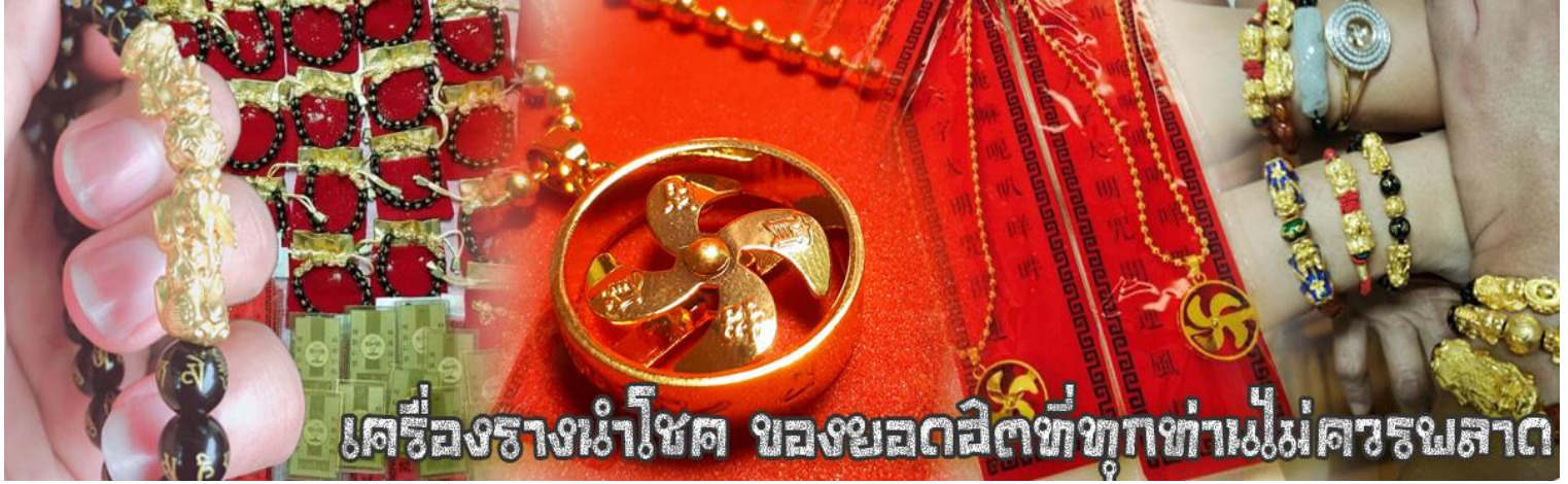
เครื่องรางนำโชค ของยอดฮิตที่ทุกท่านไม่ควรพลาด

ว่าจะเป็น “เทียนลก (กวางสวรรค์)” เป็นชื่อเดิม ส่วนจีนกวางตุ้งจะเรียกว่่า “เผ่เย้า” และคนจีนแต้จิ๋วจะเรียกว่่า “ผีชีว”และ ยังมี จำหน่ายยาสมุนไพรบำรุงเพิ่มควแ็งแรงตามควแ็งเชื่อของคนฮองกง