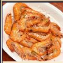
กุ้งหวานลวก