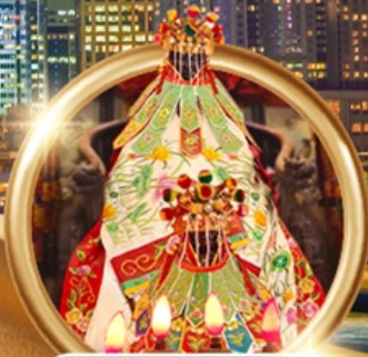
ยืมเงินเจ้าแม่กวนอิมฮ่องกง